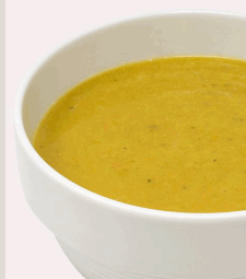
BIO Pürierte Gemüsesuppe*